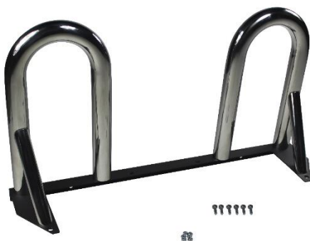
Chrom Bars Part No: WTP00B04