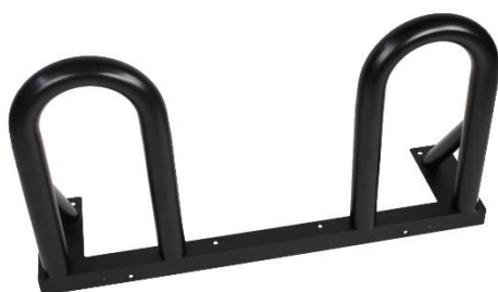
Black Bars Part No: WTP00B17