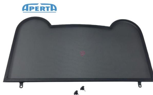
Wind Deflector Part No: 01.01.02.01